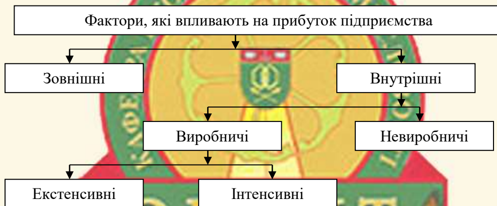
Рис. 1.4. Класифікація факторів, які впливають на величину прибутку підприємства