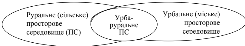
Рис. 1. Сполученість сільського та міського просторового середовища

Своє місце, на наше переконання, в системі руралістичних знань посідає й агропродовольча сфера. Слово «сфера» є спорідненим з терміном «простір» й означає область певних дій, межі розповсюдження, середовище, оточення. Базовим для слосполучень «руральний простір» та «агропродовольча сфера» є термін «агро», який характеризує все те, що має відношення до землеволодіння, землерозпорядження та землекористування. «Агро» у прив'язці до «продовольства» вказує на вид господарської діяльності, що пов'язана, з одного боку, з вирощуванням сільськогосподарської продукції та переробкою відповідної сировини в певному просторовому середовищі – з іншого. Це просторове середовище є розподіленим між міським та сільським простором й одночасно сполученим через приміську зону (рис. 1).